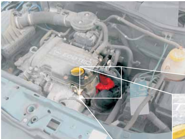
Elektrische EGR-klep in de Opel Corsa (geaccentueerd)