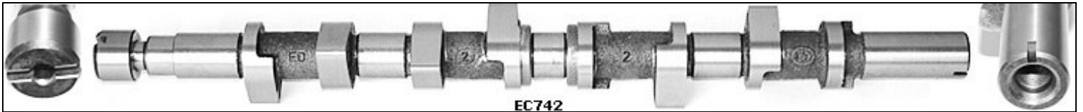
EUEC742 / AM666832 / Oe.: 8200084742 Gat op positie: 4, zonder stift en spiegroef.