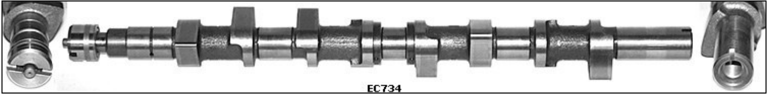
EUEC734 / AM666833 / Oe.: 77001110556 Gat op positie: 1, 2, 4 en 5, met stift en spiegroef.