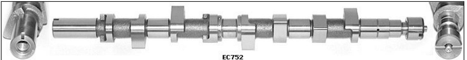
EUEC752 / AM647197 / Oe.: 8200043152 Gat op positie: 1 en 3, met stift en spiegroef.